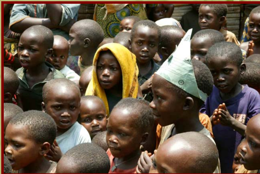
Door oorlog en honger getroffen kinderen in Congo DRC, in de Kivu, krijgen van de Drive Against Malaria hun eerste net (2007)