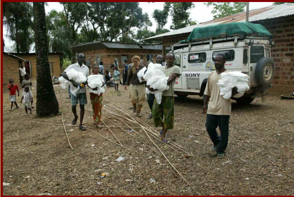
Distributie van levensreddende netten in PontNiari, Congo Brazzaville (2007)