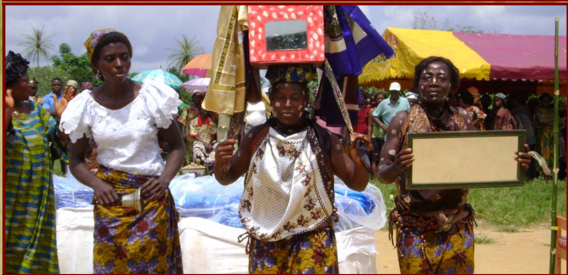
Foto: De traditionele dansen tijdens de ceremonie zijn van grote betekenis van de bevolking en zet de malaria campagne kracht bij.