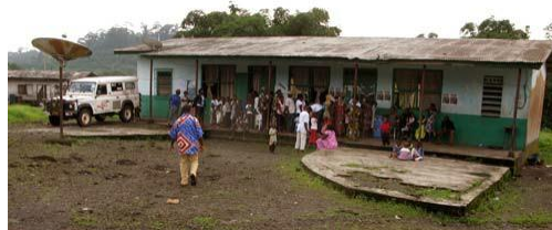
Rij wachtenden voor steunpunt