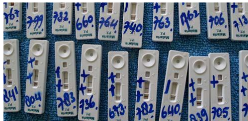
DAM begon direct met het afluimen van malariatesten