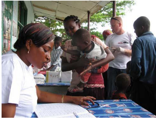
De lokale bevolking werd ingezet