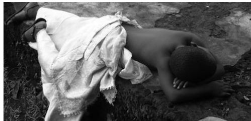
Geveel door malaria