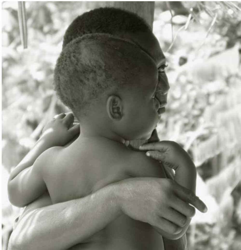
Moeder met kind wachten op consultatie