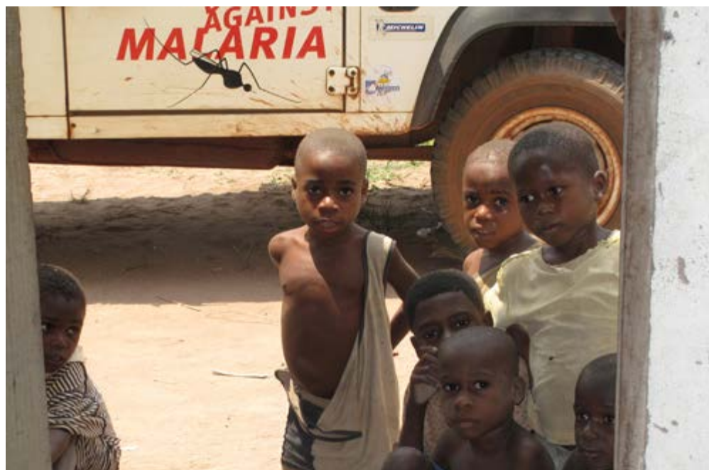
Nieuwsgierige kinderen zijn vertrouwd met DAM