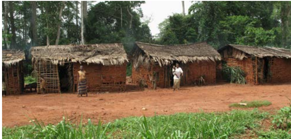
Bayaka nederzetting in het regenwoud

Het werkgebied van Drive Against Malaria (DAM) in de Dzanga Sanha is het meest onaangetaste stuk Centraal Afrikaans regenwoud. Het heeft een oogverblindende natuur en heel veel wildlife. DAM biedt hier hulp aan acht dorpen en tientallen Bayaka nederzettingen. Vorig jaar heeft DAM in verschillende nederzettingen muskietennetten uitgedeeld en alle bewoners geconsulteerd en behandeld. Nu is DAM weer terug in deze nederzettingen en worden weer alle bewoners geconsulteerd. Niemand heeft nog malaria. Een fantastisch resultaat! De bewoners zijn weer energiek en gezond en sommige hebben zelf een baantje bij het Wereld Natuur Fonds. DAM wil nu de hulp uitbereiden naar meerdere nederzettingen, zodat nog meer Bayaka gezonder door het leven kunnen.