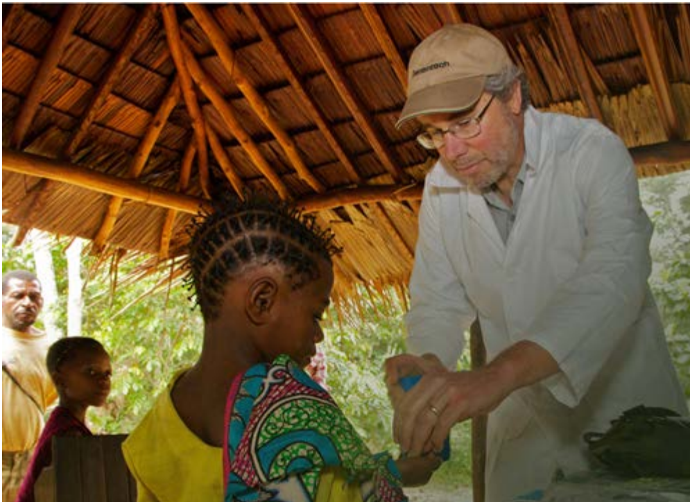
Alle dorpsbewoners worden systematisch getest

"In deze dorpen hebben onze teams malaria volledig onder controle. We leveren muskietennetten voor alle gezinnen, zorgen voor effectieve medicatie waartegen geen enkele resistentie bestaat en werken met snelle malariatests waarmee wij alle soorten malaria kunnen opsporen. Zodra iemand geïnfecteerd is, kan hij meteen getest worden op malaria, waarna wij de patiënt behandelen met effectieve medicatie. Na drie dagen is de patiënt volledig genezen. Door deze doeltreffende aanpak komen sterfgevallen niet meer voor. Tijdens reguliere testdagen traceren we slechts enkele infecties die meteen geëlimineerd kunnen worden." Maar voegt hij eraan toe: "Veel getroffen afgelegen gebieden worden genegeerd en liggen nog steeds buiten schot van hulp."