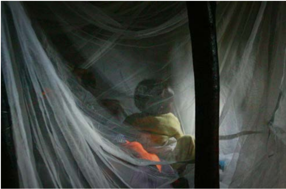
Malariabescherming dankzij een muskietennet

"In deze dorpen hebben onze teams malaria volledig onder controle. We leveren muskietennetten voor alle gezinnen, zorgen voor effectieve medicatie waartegen geen enkele resistentie bestaat en werken met snelle malariatests waarmee wij alle soorten malaria kunnen opsporen. Zodra iemand geïnfecteerd is, kan hij meteen getest worden op malaria, waarna wij de patiënt behandelen met effectieve medicatie. Na drie dagen is de patiënt volledig genezen. Door deze doeltreffende aanpak komen sterfgevallen niet meer voor. Tijdens reguliere testdagen traceren we slechts enkele infecties die meteen geëlimineerd kunnen worden." Maar voegt hij eraan toe: "Veel getroffen afgelegen gebieden worden genegeerd en liggen nog steeds buiten schot van hulp."