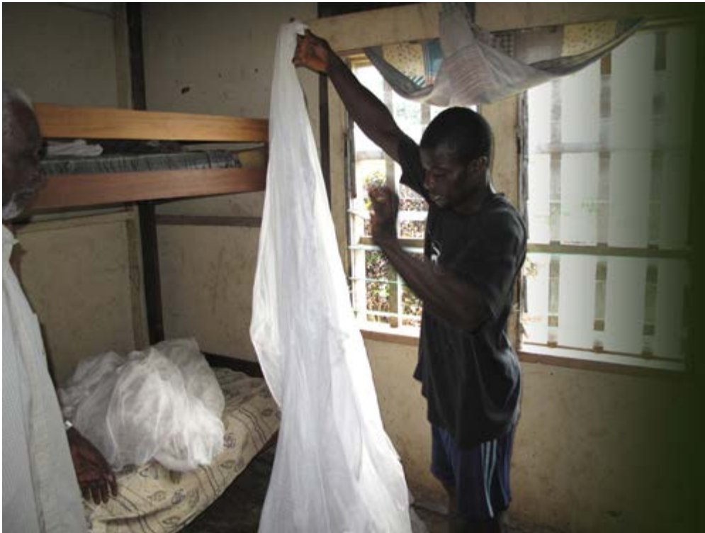
Malariabescherming dankzij een muskietennet