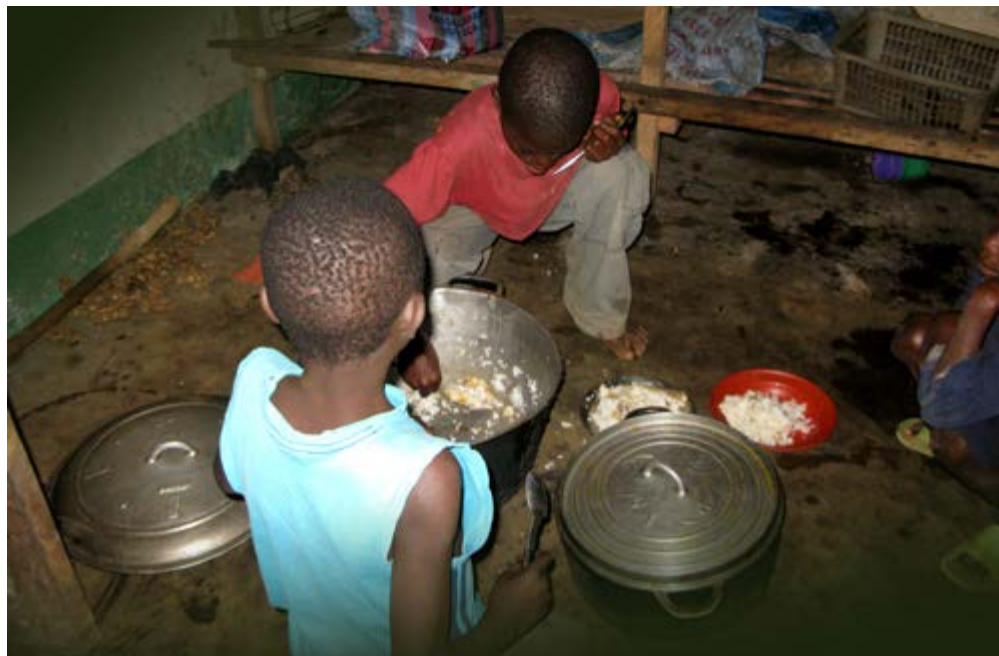
Weeskinderen zijn extra kwetsbaar

Elke dag raken er in Batoke in Afrika kinderen ouderloos. Grootouders of familieleden proberen zoveel mogelijk van deze weeskinderen onder hun hoede te nemen. Maar de mensen zijn arm. En het aantal verwaarloosde weeskinderen groeit met de dag. Daarnaast worden er in Afrika veel kinderen achtergelaten in het ziekenhuis. Na de geboorte of tijdens ziekte, omdat de ouders niet in staat zijn de ziekenhuisrekening te betalen. Van deze kinderen is geen identiteit bekend en de overheid brengt hen onder in weeshuizen. Voor de gemeenschap ligt er een zware taak en uitdaging om deze kinderen op te laten groeien tot gezonde volwassenen.