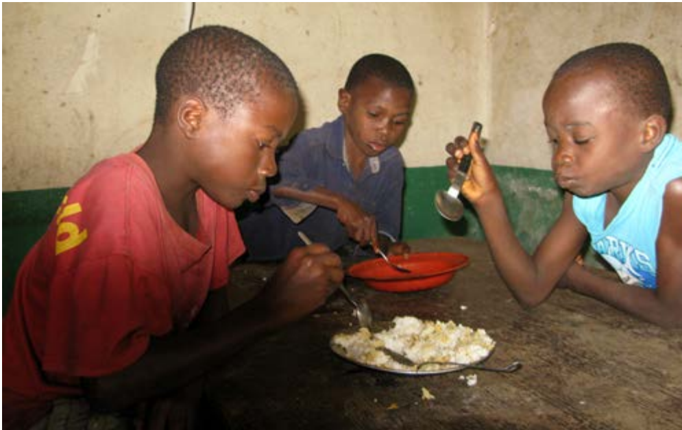
Weeskinderen lijden aan chronische ondervoeding

Diverse malen per jaar worden alle kinderen systematisch getest en behandeld. DAM laat de weeskinderen van Batoke niet in de steek.