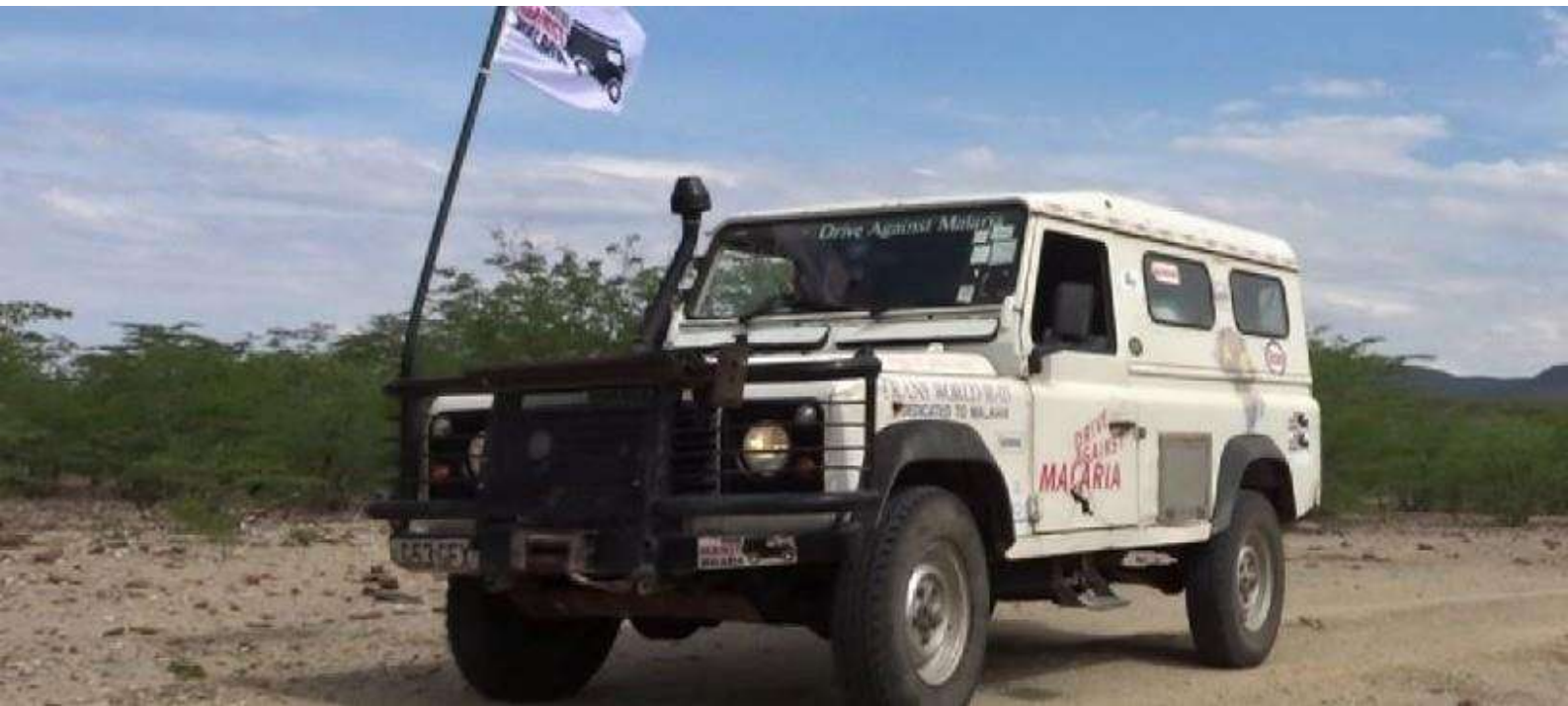
FOTO : Om de hulpverlening te realiseren moet DAM nog veel obstakels overwinnen: een gedegen humanitaire corridor van enkele dagen over de gesloten grens.