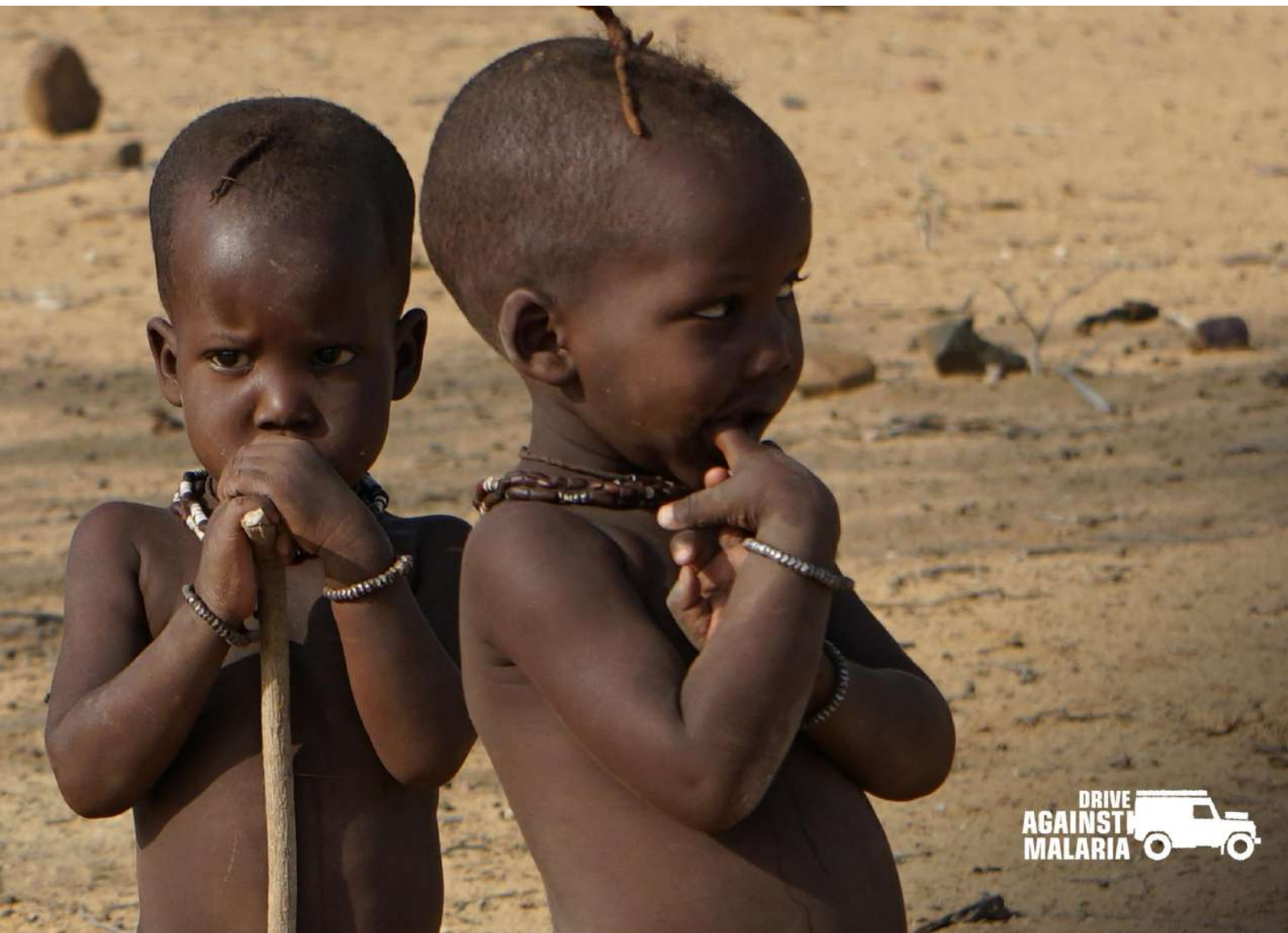
FOTO : Zij worden over het hoofd gezien, overgeslagen en op een zijspoor gezet.