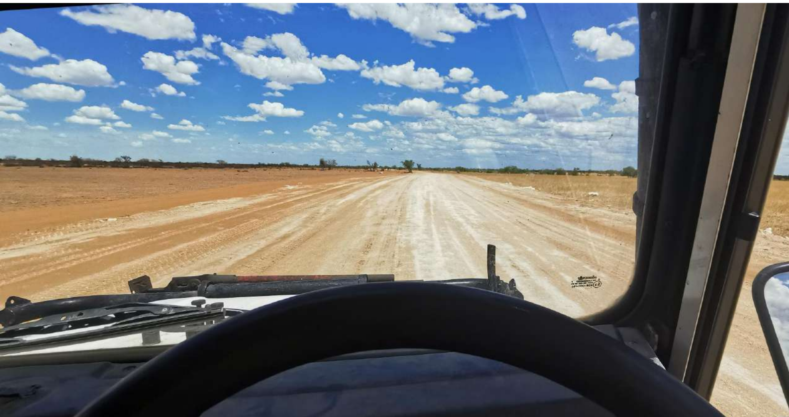
FOTO : De DRIVE is 3.766 Mijl lang om de stammen achter de grenzen van de geïsoleerde regio's te bereiken