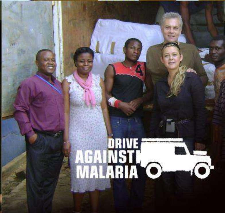
Foto: De inbreng van Yameni heeft een enorm positieve impact op het succes van de hulpprojecten