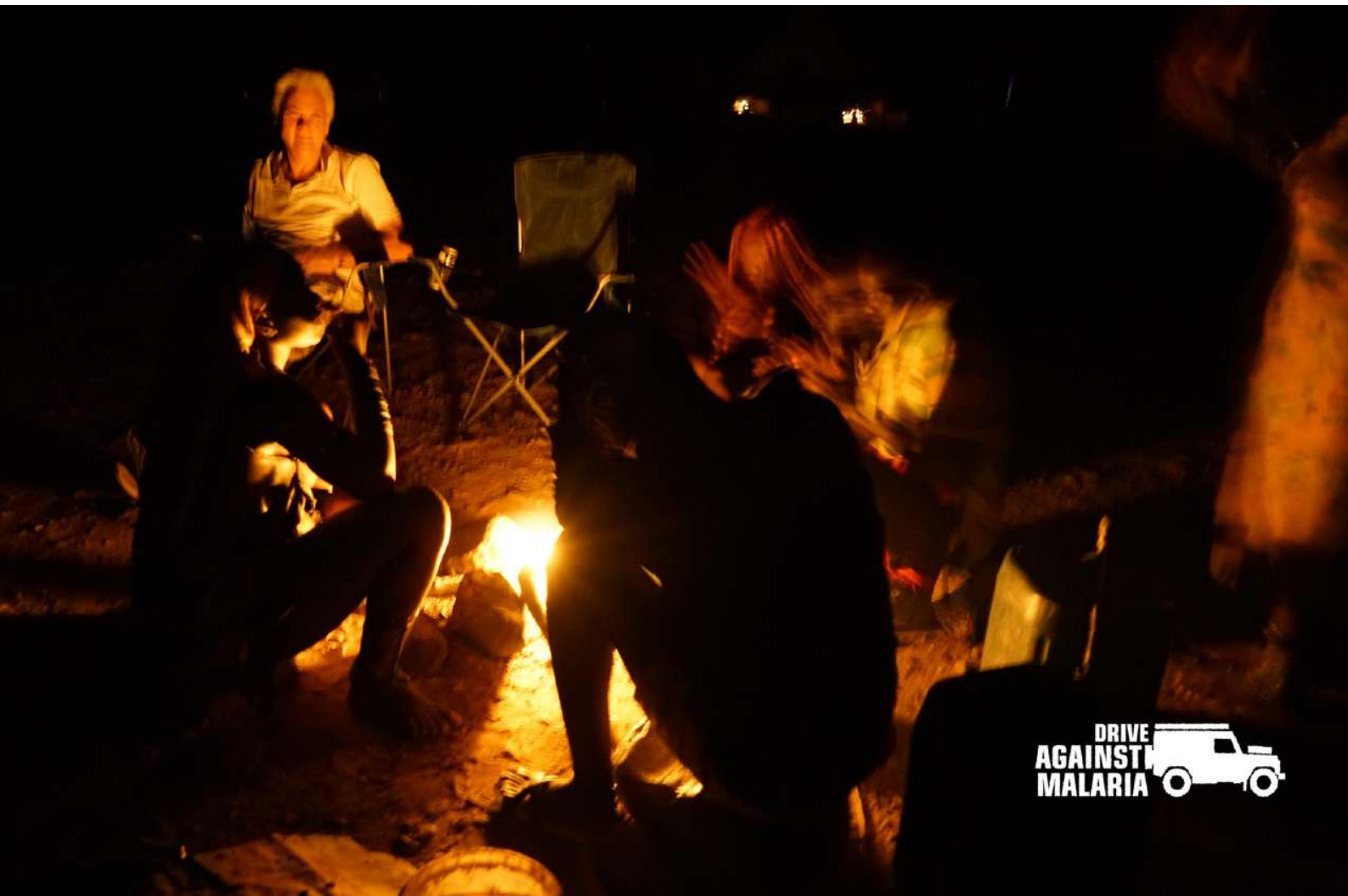
FOTO: In de avonden sámen rond het kampvuur. De stammen hebben dit nooit eerder meegemaakt.