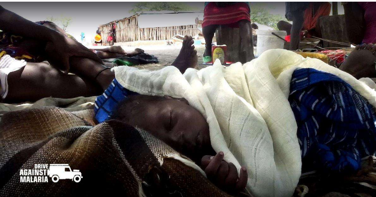
FOTO : 36 kinderen zijn al omgekomen in de kampen.