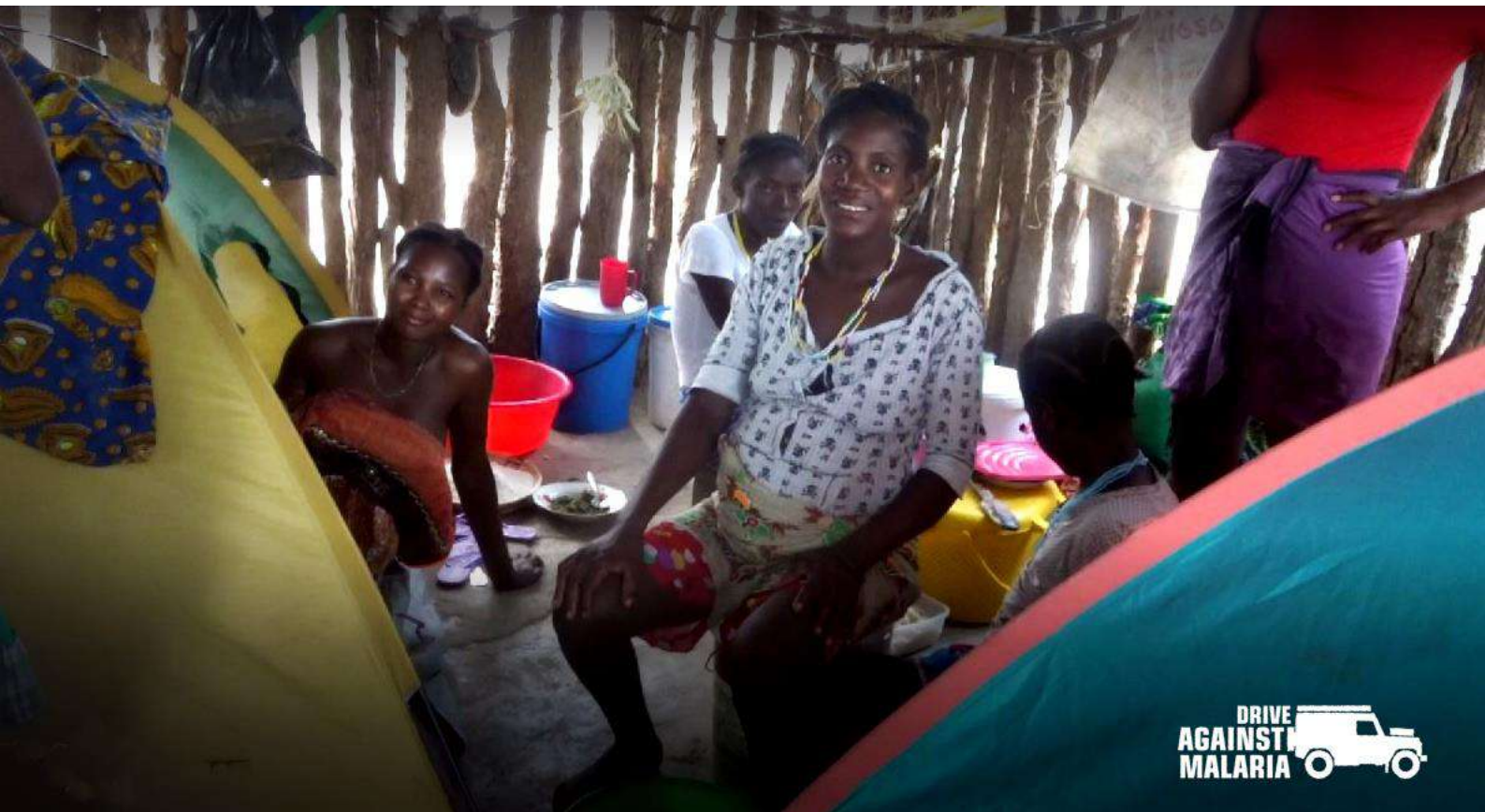
FOTO : Gisteren hebben we de hulpactie verhoogd met nog eens 2.000 kuren