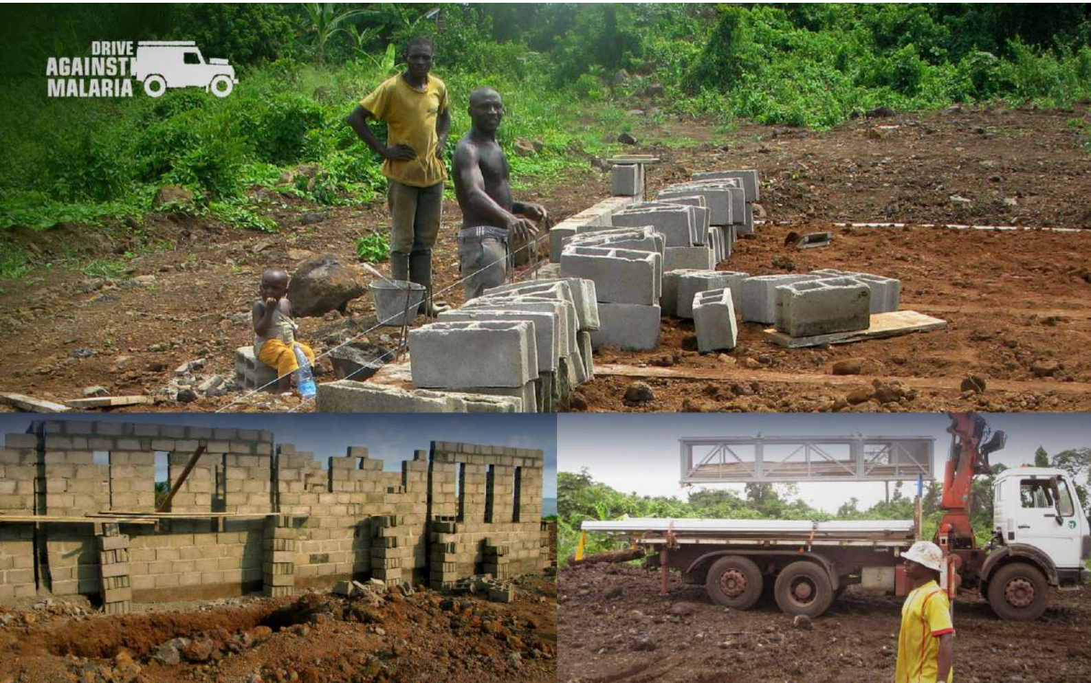
FOTO : Ook in deze spoedklinieken zullen we straks honderden zieken behandelen, en dat is hoog nodig.