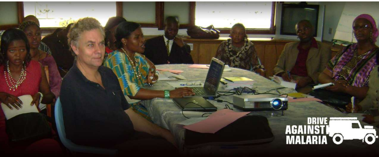
FOTO : In de regio's waar elektriciteit beschikbaar is, zorgen we voor laptops voor de lokale medewerkers. Het is een belangrijk instrument voor de hulpprojecten en de eigen communicatie en toekomst van onze collega's.