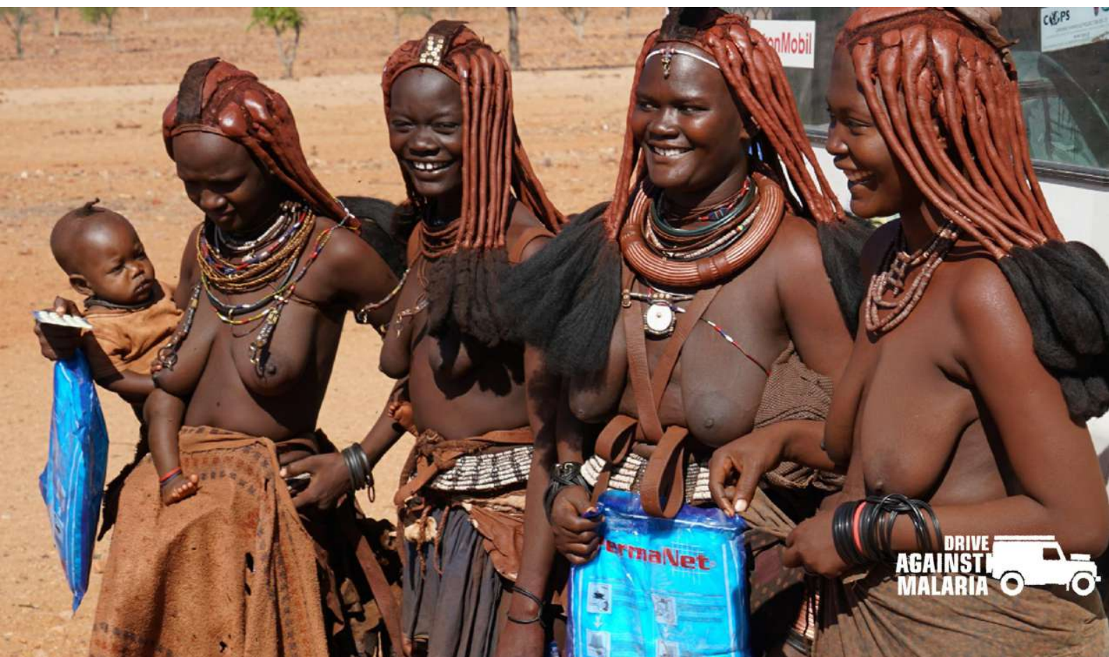
FOTO : Zodra Malaria in hun nederzetting binnendringt heeft dit een dramatische impact in het leven van de stammen. De moeders zijn oprecht dankbaar voor DAM's hulp.