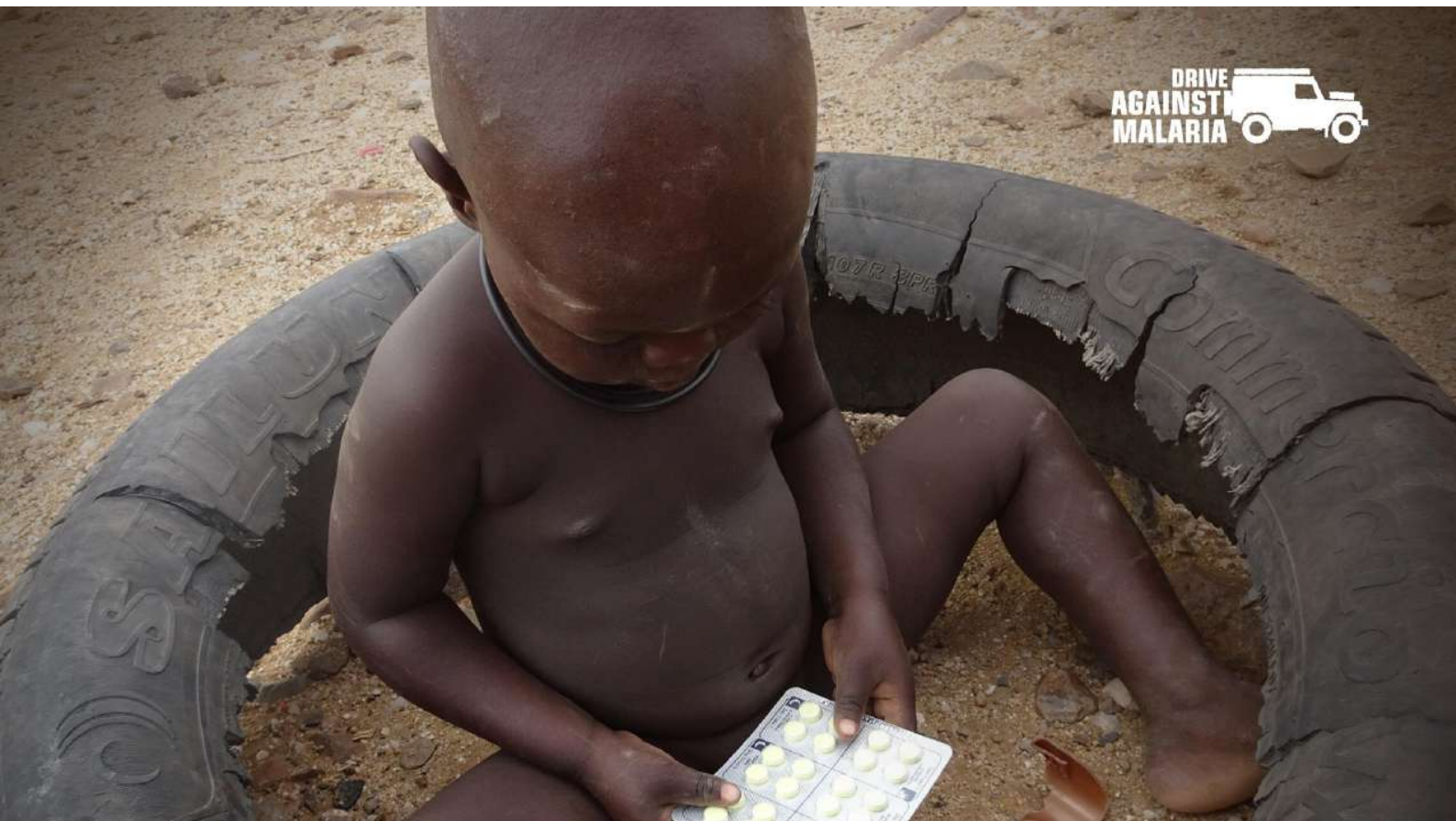
FOTO: Jonge kinderen die zijn besmet met Malaria kunnen de ziekte niet overleven zonder geneesmiddelen.