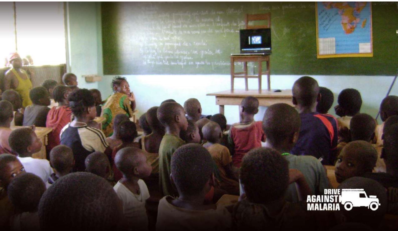
FOTO: In gebieden – zoals hier in de Congo Basin – hebben de kinderen nooit eerder een Laptop gezien. In 86% van de gebieden waar DAM werkt is namelijk géén elektriciteit en géén Internet.