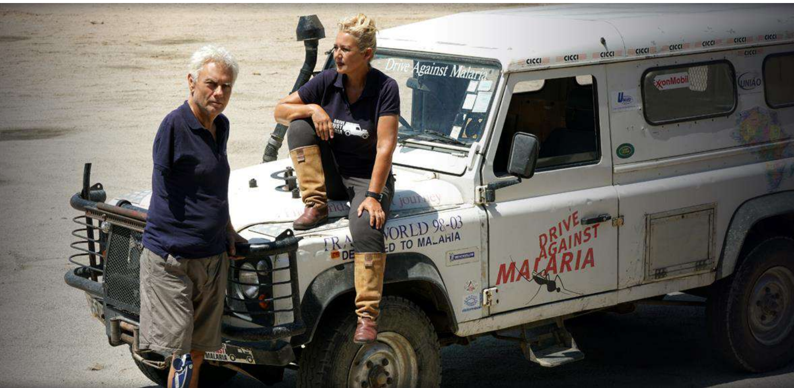
FOTO : We hebben gehoor gegeven aan de oproep van de regering om getroffen families te helpen