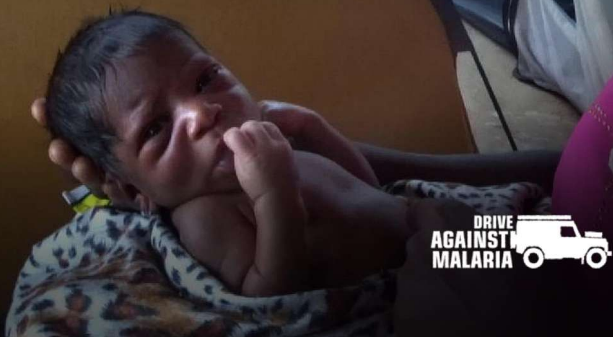
FOTO : Moeders met baby's moeten maandenlang in kamptenten leven