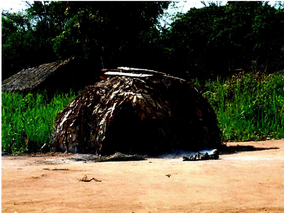
De droge savanne waar de Bayaka leven

Duizenden jaren waren de Pygmeeën meester van het tropische regenwoud in het hart van Afrika. Door ontbossing zijn grote gebieden bos veranderd in droge savannen, gebied waar de Bayaka Pygmeeën nauwelijks kunnen overleven. Naast dat de Bayaka Pygmeeën verdreven zijn uit hun natuurlijke leefomgeving, hebben zij te kampen met malaria. Zij hebben in het hart van het tropisch regenwoud geen enkele resistentie opgebouwd tegen deze parasitaire ziekte, omdat zij nooit eerder met malaria in aanraking kwamen.