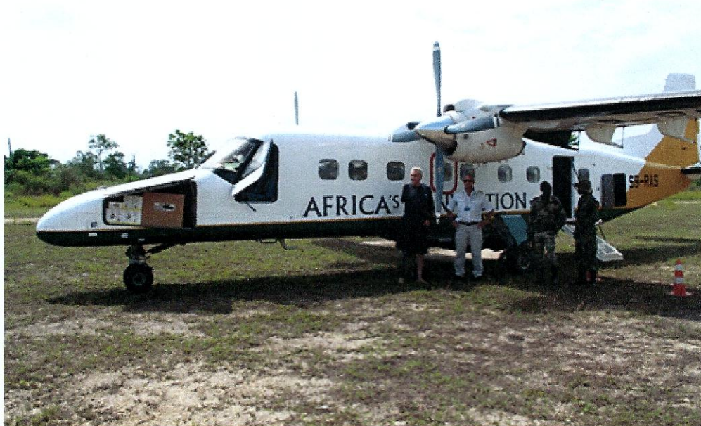
De hoognodige ingevlogen medicatie

Wanneer Drive Against Malaria in 2009 komt, zet zij Monasao en daarmee de missiepost hoog op de prioriteiten lijst. De eerste stappen worden gezet voor permanente hulp aan de missiepost. De distributie van geïmpregneerde netten wordt gestart, om verdere verspreiding van malaria tegen te gaan. Ook zorgt DAM voor Rapid Diagnose Tests, zodat de mensen die zich melden bij de missiepost meteen getest kunnen worden op malaria. En er wordt medicatie vanuit verschillende plekken ingevlogen om de vele Pygmeeën die besmet zijn, direct te behandelen.