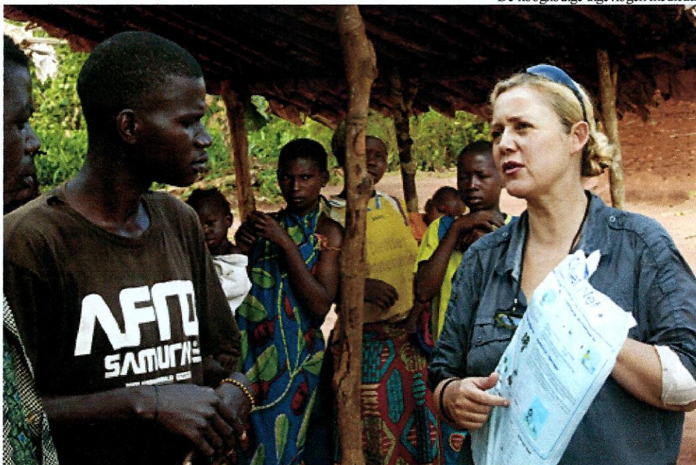
Uitleg over het verdelen van de netten