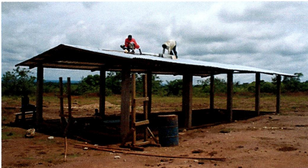
Een nieuw onderkomen voor de missiepost