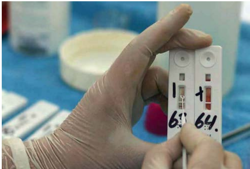
DAM roept de bevolking op om zich te laten testen