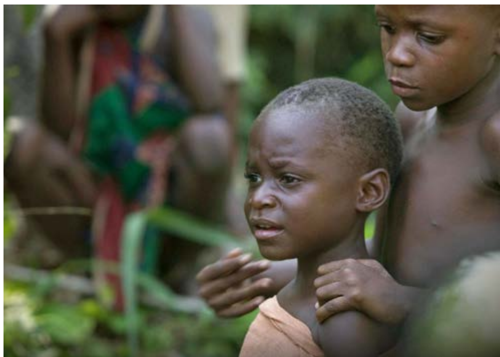
Voor de pygmeë kinderen is malaria snel dodelijk

In het oosten van Kameroen heeft Drive Against Malaria de afgelopen maanden meer dan 3.000 kinderen behandeld tegen malaria. De campagne moest worden opgeschort vanwege de precare veiligheidssituatie in dit gebied dat grenst aan de Centraal Afrikaanse Republiek, waar verschillende gewapende groepen aanwezig zijn en waar frequent gevechten ontbranden.