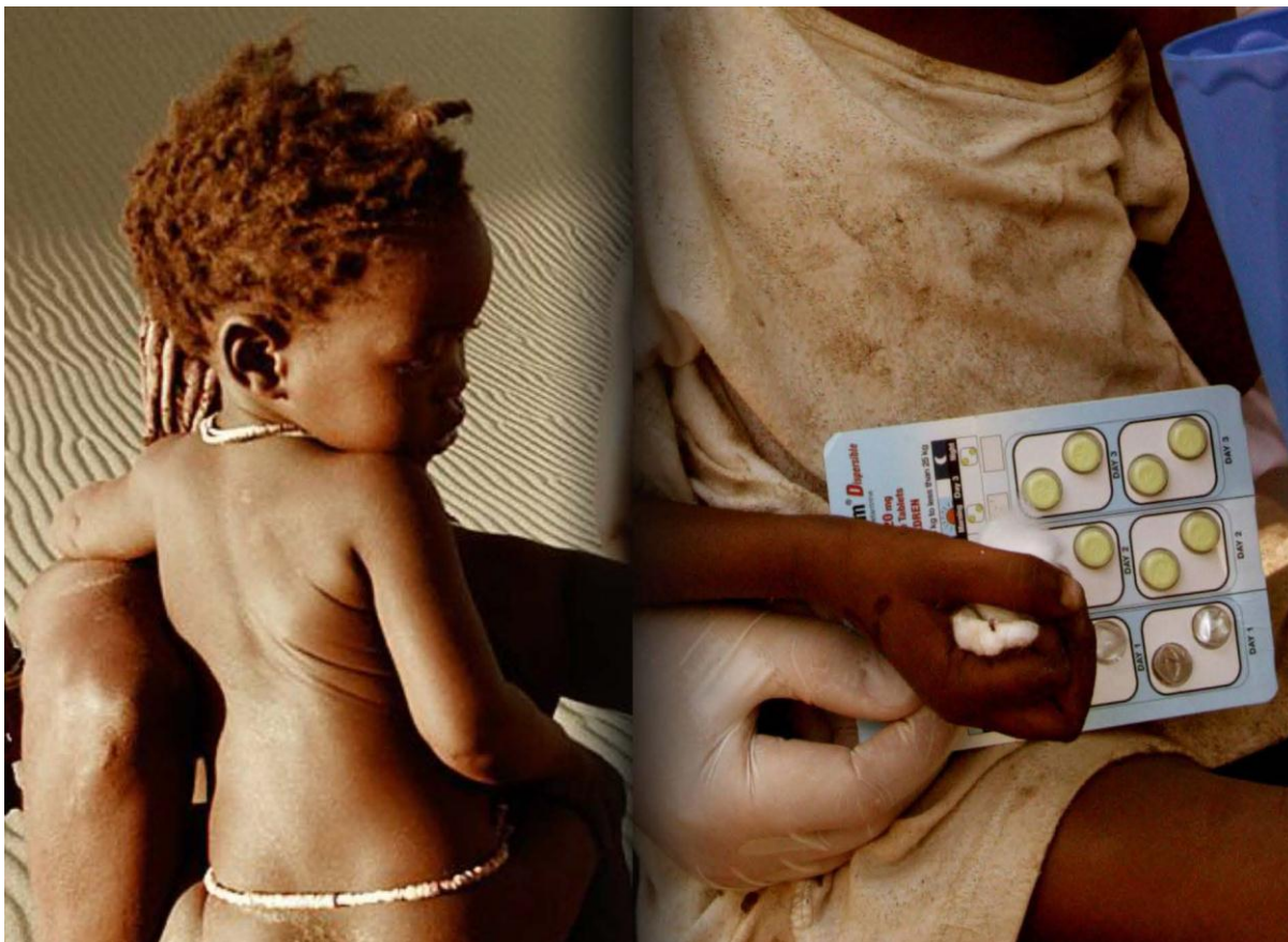
Zieke kinderen hebben medicijnen nodig om malaria te kunnen overleven

(Samenstelling & edit: Heleen Depaltier & Johan Nebbeling)