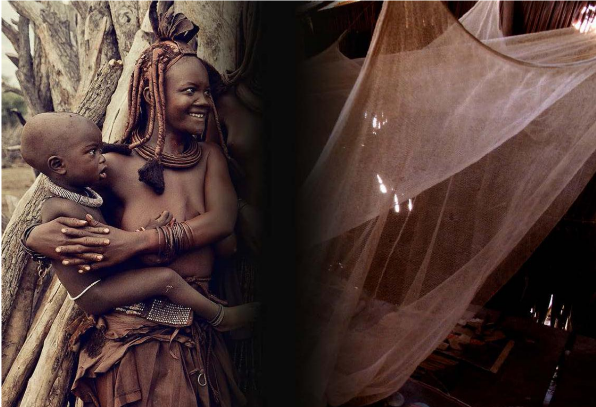
Met geïmpregneerde muskietennetten kunnen we uitbraken voorkomen

Het zijn vooral de stammen die in het grensgebied met Angola rondtrekken die het zwaarst te lijden hebben van malaria. 'Verwoestend', noemde een vertegenwoordiger van de Wereldgezondheidsorganisatie WHO de uitwerking van de ziekte op deze grensbewoners. Stijgende temperaturen en een toename van de hoeveelheid neerslag als gevolg van de klimaatverandering zorgen bovendien voor een toename en grotere verspreiding van malaria.