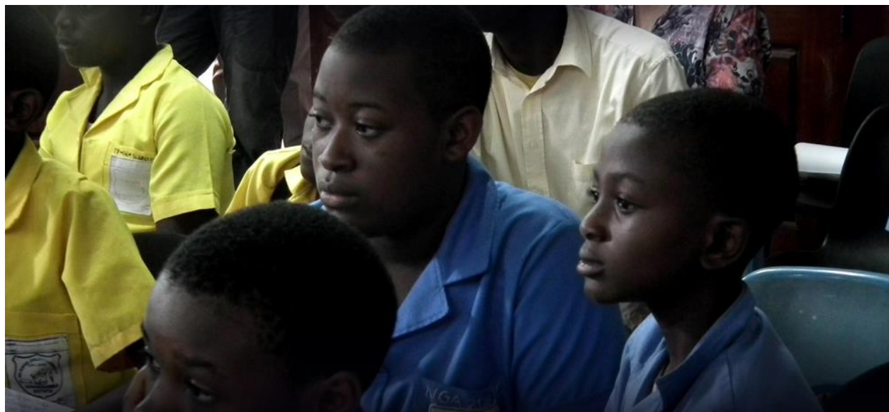
De kinderen kijken geboeid naar de films die we vertonen

Het was voor de jury heel erg moeilijk om te kiezen. Eigenlijk is er niet één het beste of het creatiefste, want alle voordrachten waren knap gemaakt en heel goed voorbereid! We mochten een 1 e , 2 e en 3 e prijs weggeven. Waaronder een heel speciaal certificaat, een waardebon en knuffelaapjes. Eén school sprong eruit door drie bijzondere onderdelen. Deze kinderen hadden een hele mooie voordracht gehouden, gezongen en mooie tekeningen gemaakt en hadden het thema perfect weergegeven. Daarom kregen de kinderen van de ALCEF school de eerste prijs. Tot slot kreeg elk kind een muskietennet en daarna hebben we alle kinderen op de foto gezet. Vervolgens werden zij als 'heroes' ontvangen op hun scholen waar ze werden overspoeld met vragen. Het was voor iedereen een onvergetelijke dag. Voor groot en klein, jong en ouder.