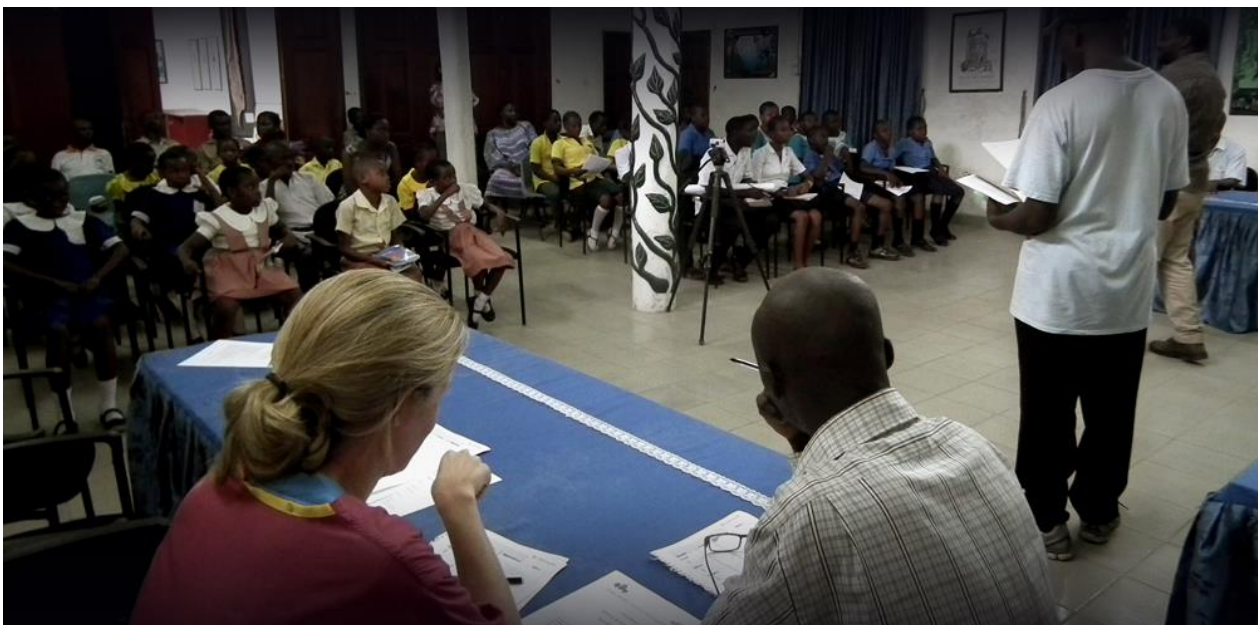
Samen met de scholen kunnen we grote thema's bespreekbaar maken

Eén van de prioriteiten van Drive Against Malaria is om in de gebieden waar malaria een groot probleem vormt, voorlichting en educatie te geven. Educatie is een belangrijk onderdeel van ons werk. Ook de kinderen moeten beslist worden voorgelicht worden over malaria, de symptomen en hoe mensen infectie kunnen voorkomen. Zij krijgen uitleg over het gebruik van muskietennetten en we vertellen welke effectieve voorzorgsmaatregelen zij kunnen nemen voor hun woonomgeving.