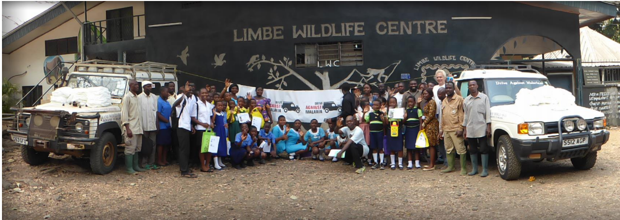
Kinderen van 11 scholen doen mee aan het evenement

(Samenstelling Glenn & Anna) In samenwerking met 'Limbe Wildlife Centre' (LWC) organiseert Drive Against Malaria een speciaal event over het thema 'Malaria en Ontbossing'. Veel gebieden in Afrikaanse landen hebben te maken met een hoge mate van ontbossing en achteruitgang. Er komt steeds meer bewijs dat ontbossing en malaria met elkaar in verband staan! In bosgebieden komt malaria immers nauwelijks voor. Ontbossing veroorzaakt licht en stilstaand water met hogere temperaturen. Hierdoor ontstaan broedplaatsen voor de muskieten die malaria verspreiden. Kortom, ontbossing en illegale kappraktijken vormen een grote bedreiging voor de mens door de verspreiding van malaria.