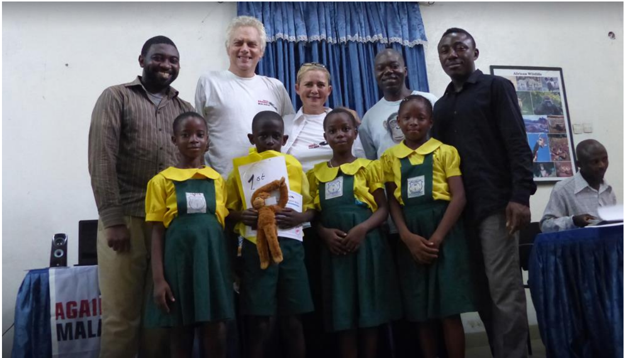
De kinderen van de ALCEF school zijn dolblij met hun eerste prijs