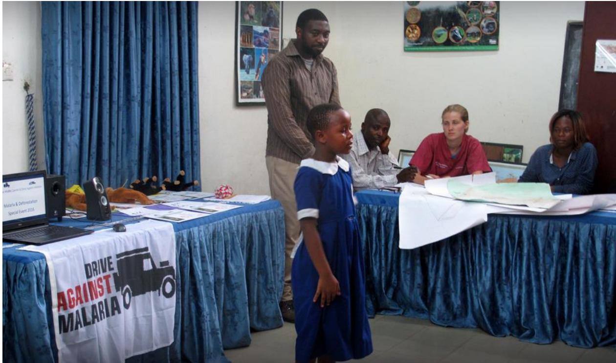
Wat een prachtige voordrachten hebben de kinderen gegeven